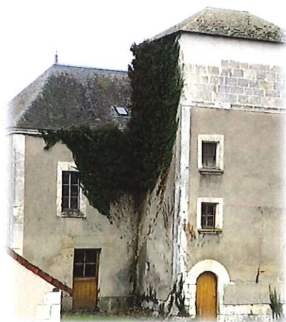
... et aujourd'hui