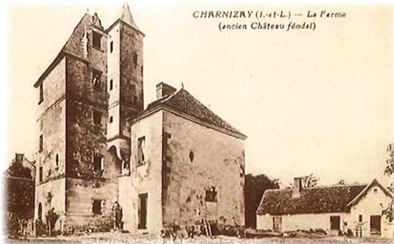
CHARNIZAY (I.-et-L.) — La Ferme (ancien Château féodal)